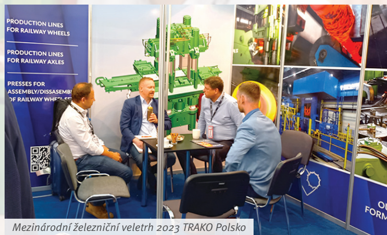
Mezinárodní železniční veletrh 2023 TRAKO Polsko