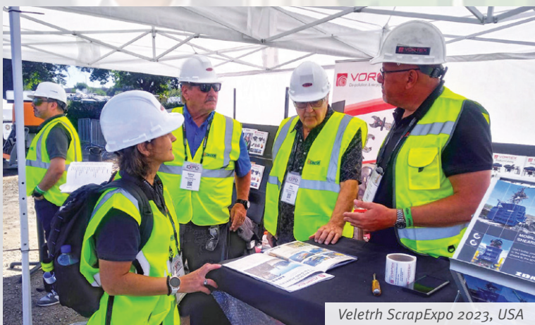
Veletrh ScrapExpo 2023, USA

osobně prezentovat naše možnosti v oblasti dodávek pro železniční průmysl, jako jsou linky na výrobu železničních kol, linky na výrobu železničních náprav, lisů na montáž železničních dvojkolí a metalurgickou produkci, jako například odlitky podvozků. Na našem stánku proběhla řada zajímavých a důležitých setkání.